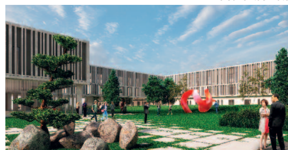
Lo Juventus Hotel

«Abbiamo deciso di portare all'interno di un mondo antico e prestigioso, quale è quello dell'edilizia, l'agilità e l'innovazione che sono tra le cifre che caratterizzano la nostra modernità. Per questo siamo stati i precursori in Italia della finanza di progetto , uno stru-