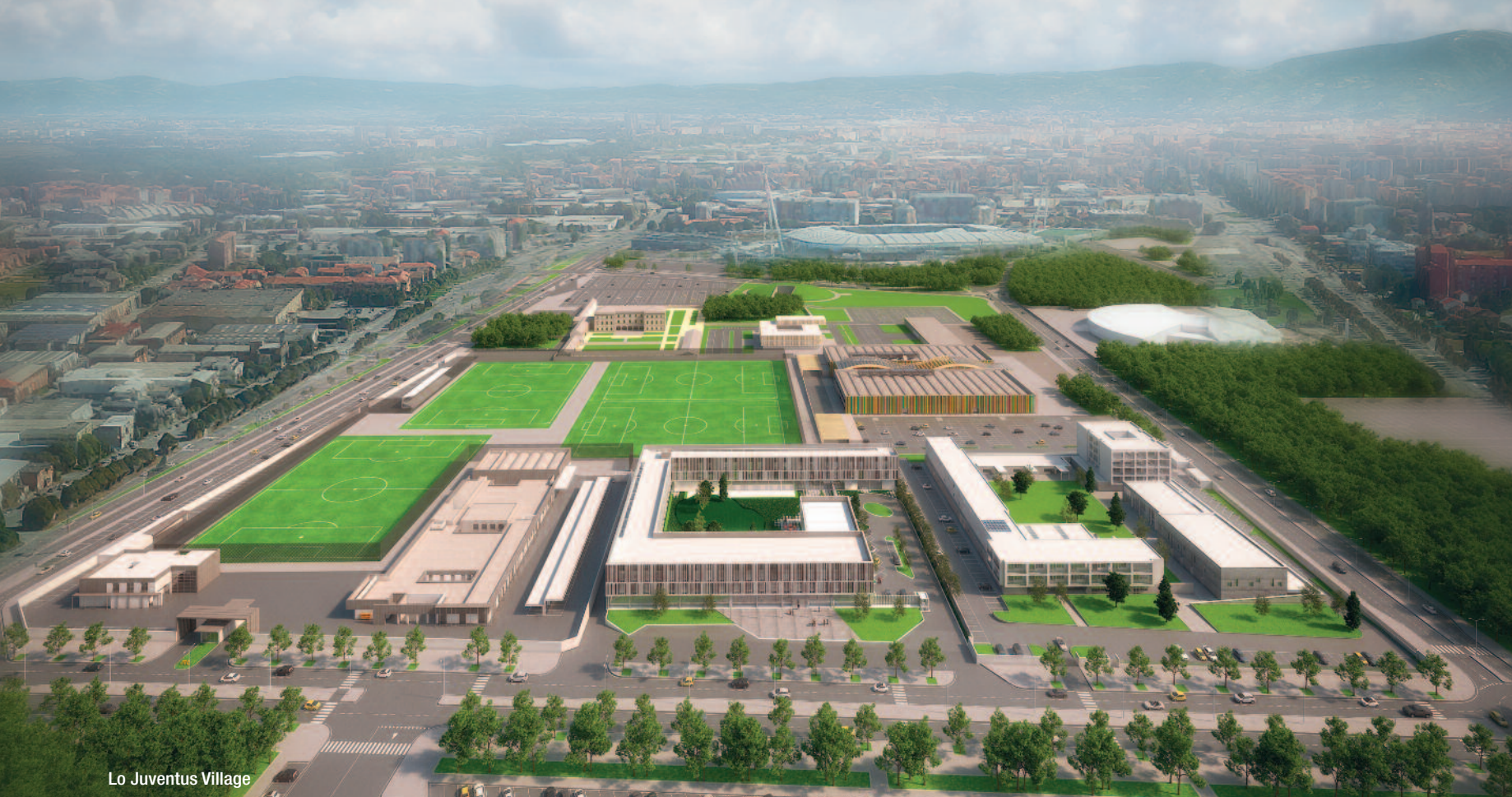
Lo Juventus Village