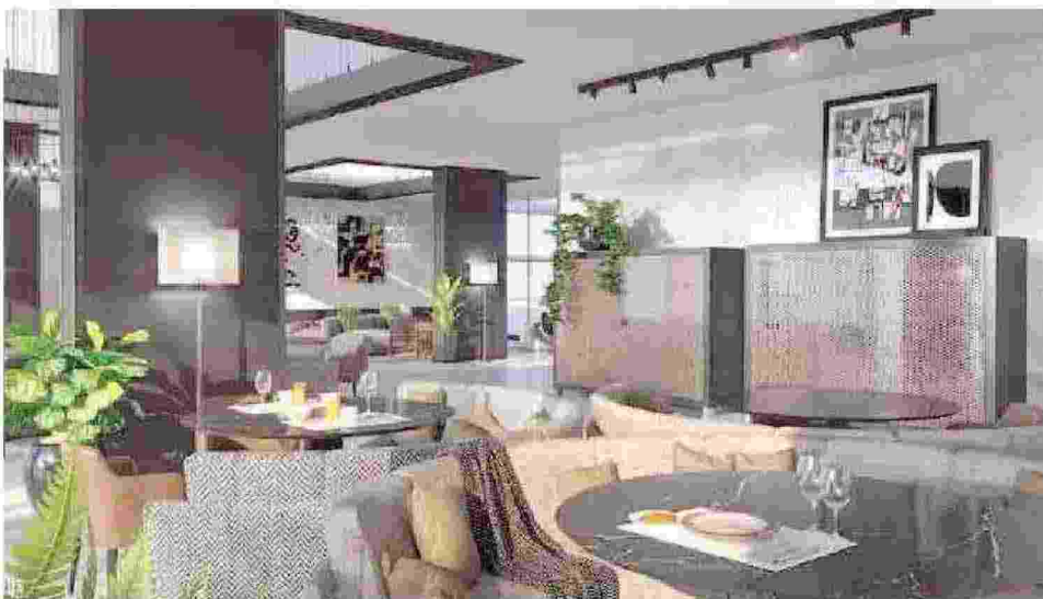
Una delle poche immagini dell'interno del «J Hotel» diffuse dalla Juventus sul suo sito