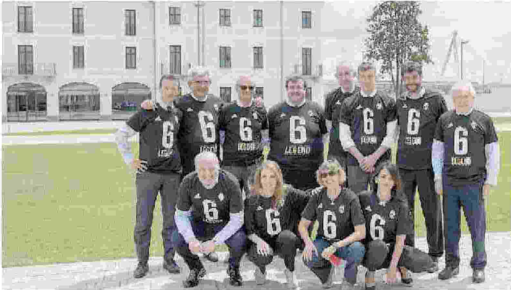
La foto ricordo del Cda della Juve quando si è riunito per la prima volta nella nuova sede (alle spalle)